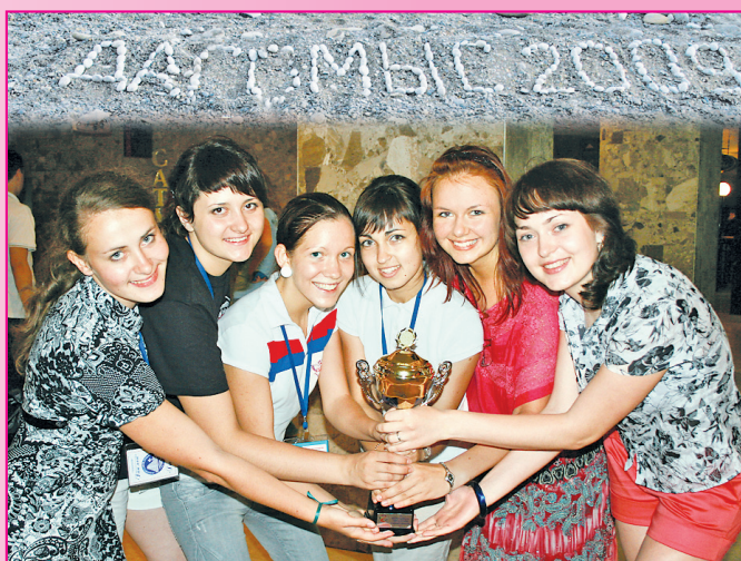
Кубок Международного фестиваля – в рязанских руках.