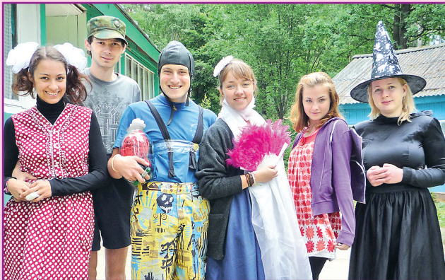
Вожатые подарили детям сказку.

Как и во всех лагерях, у нас была своя тематика. Я была на корабле «Дружба». Все вожатые были капитанами, а детки – юнгами, отряды – флотилиями. Каждая флотилия за участие в общелагерных мероприятиях получала «кусочки» ниточки дружбы, из которых составлялась общая нить на отряд.