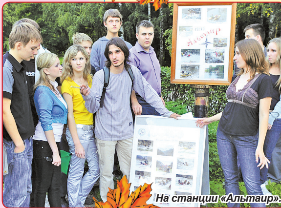
На станции «Альтаир».