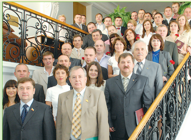
Выпускники и руководители Президентской программы после вручения дипломов.