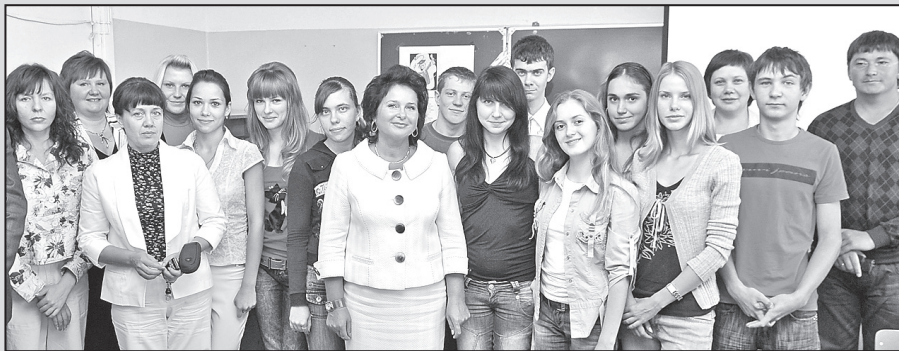
Преподаватели и первокурсники кафедры.

тие творческого потенциала студентов; отработать проведение учебных занятий с использованием активных методов обучения; создать условия для развития научно-технического творчества студентов и их участия в выполняемых кафедрой научных исследованиях; расширить число программ дополнительного образования.